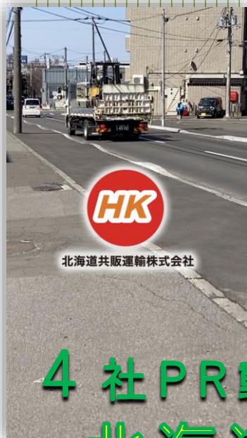
北海道共販運輸株式会社