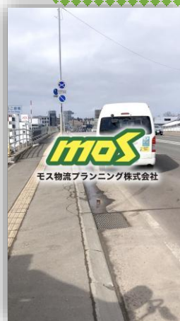
モス物流プランニング株式会社