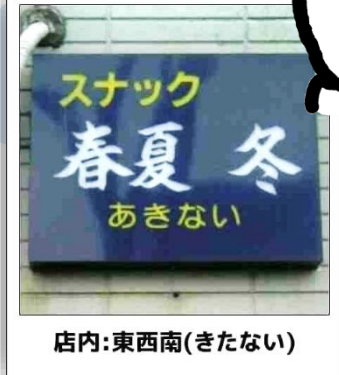
店内:東西南(きたない)